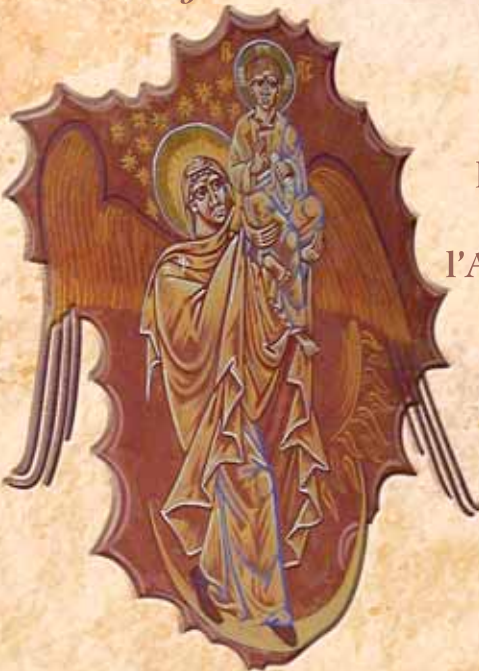
la Vierge de l'Apocalypse