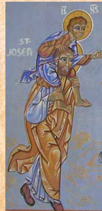
Saint Joseph le retour d'Egypte