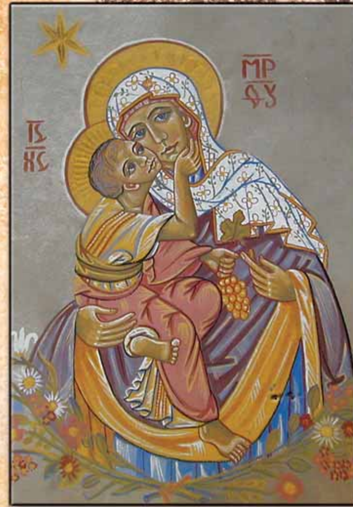
Vierge de Tendresse