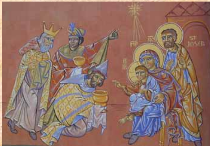
L'adoration des Mages