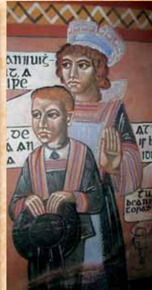
Ornant le tour de l'Eglise, les peuples du mon- de entier prient la vierge dans leur langue