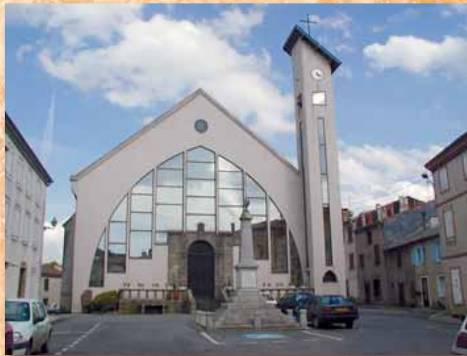
L'Eglise d'Alban de nos jours