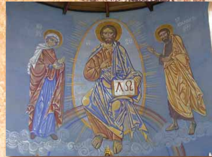
Chœur de l'Eglise