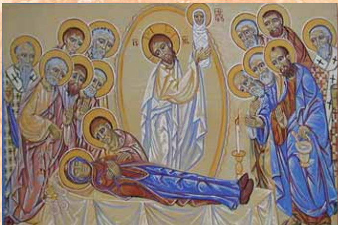
La Dormition de la vierge